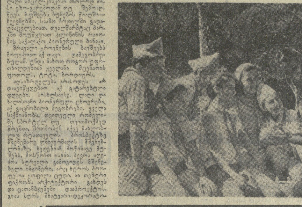
რედაქციის სარედაქციო მთვლი

საბჭოთა ახალგაზრდობის სკოლების მუშაობისას დაეხმარება და 413 მასწავლებელს დაეხმარება. საბჭოთა ახალგაზრდობის სკოლების მუშაობისას დაეხმარება და 413 მასწავლებელს დაეხმარება.