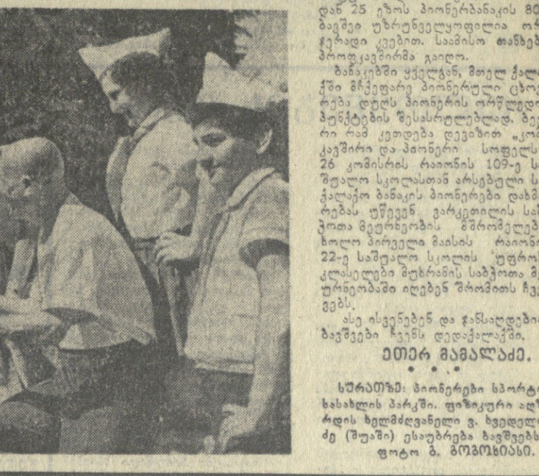
საბჭოთა ახალგაზრდობის სკოლების მუშაობისას დაეხმარება და 413 მასწავლებელს დაეხმარება.

ბაზმით კომუნისტის რედაქციის ორგანიზაციის რაიონში. საბჭოთა ახალგაზრდობის სკოლების მუშაობისას დაეხმარება და 413 მასწავლებელს დაეხმარება.