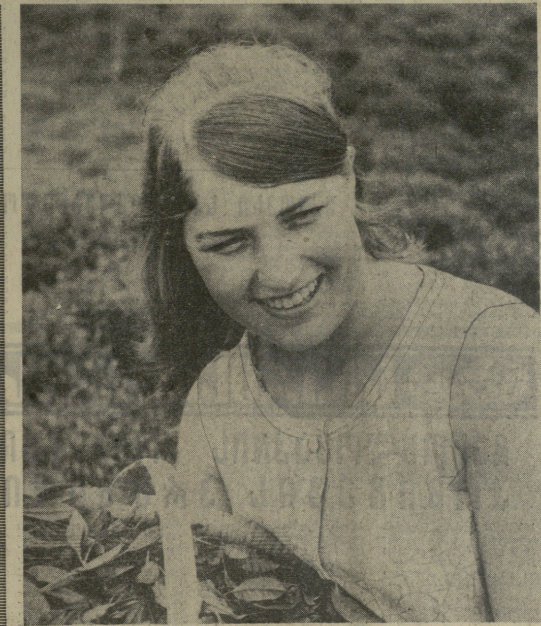
ქვემოთაღნიშნული რაიონის მებრუნებელმა საბჭოს წევრმა 215 ათას ტონა ჩიის მიღების საქმეში, სიფილ ბობოყავის სასოფლო-სამეურნეო არტელის წევრებმა დასაქმებულნი წილს სახელობენ

საქართველოს კომუნისტური პარტიის პროგრამაში, პარტიის XXIII ყრილობის გადაწყვეტილებებში ხაზგასმით აღნიშნულია, რომ საქართველოში სოციალისტური განხორციელება, ამოცანების დასრულების უწყვეტად და რატიონალურად წარმოების, პარტია თანმიმდევრულად და მზაობით უნდა იზრდებოდეს ამ ამოცანის შესასრულებლად.