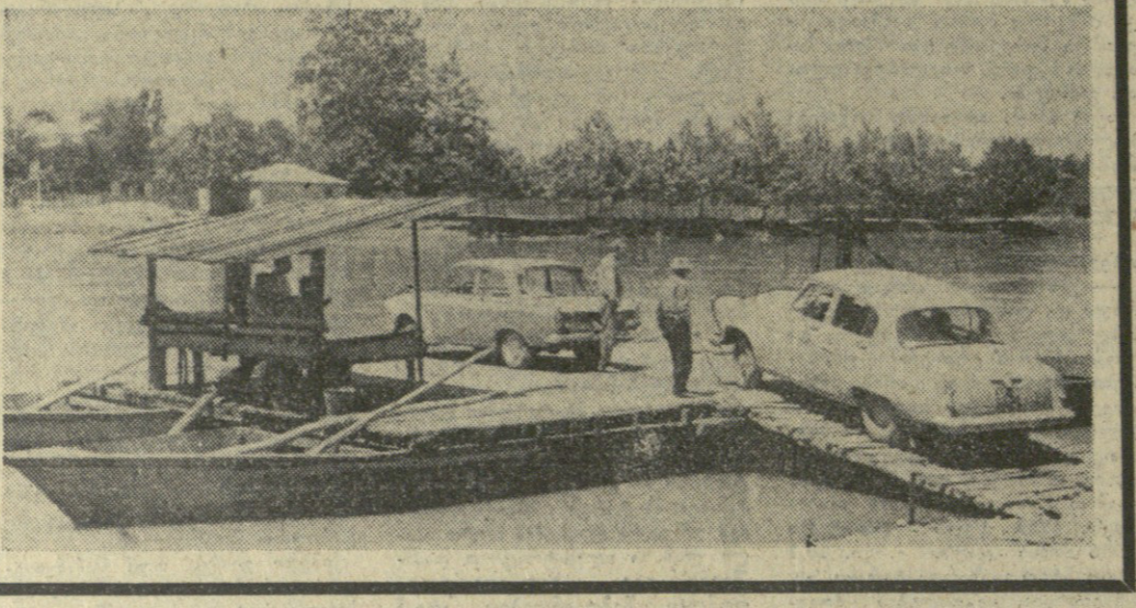
ფრთვობიანიპივივის მშენებლობის სურათი