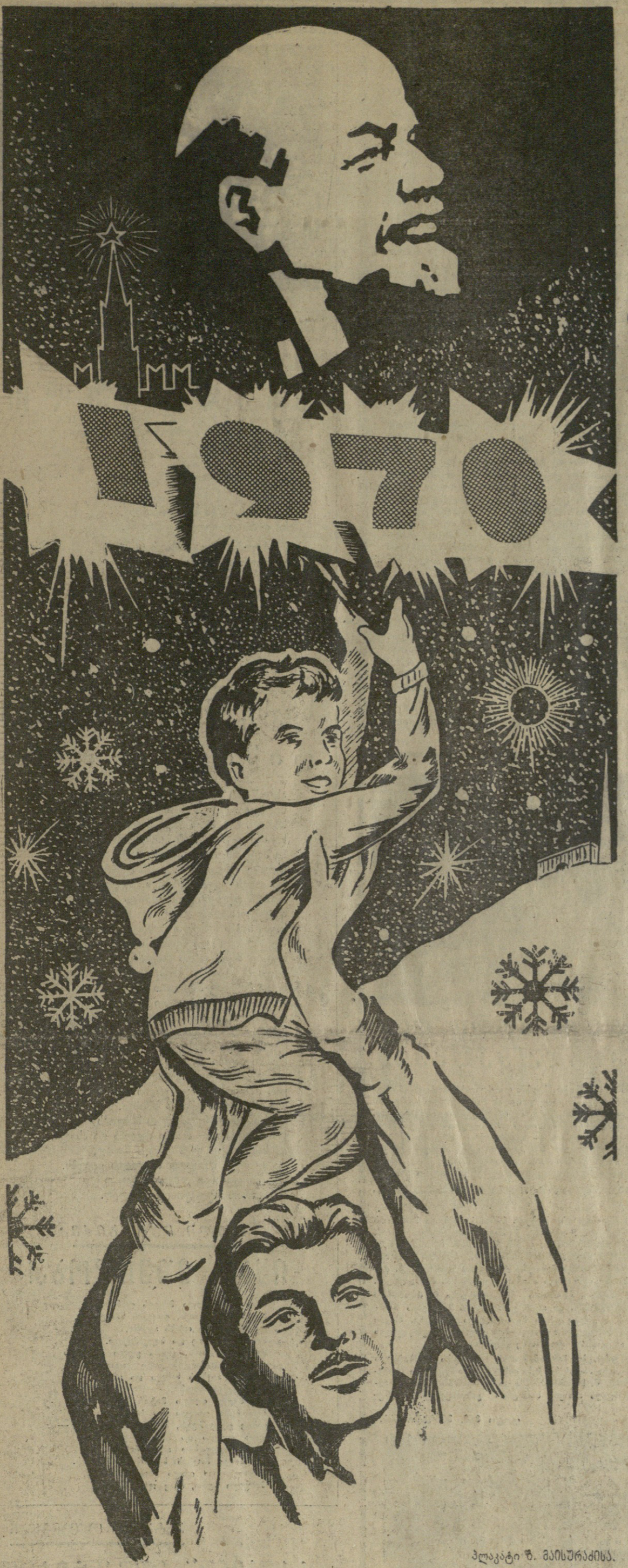
ალაკატი შ. მისურაძისა.