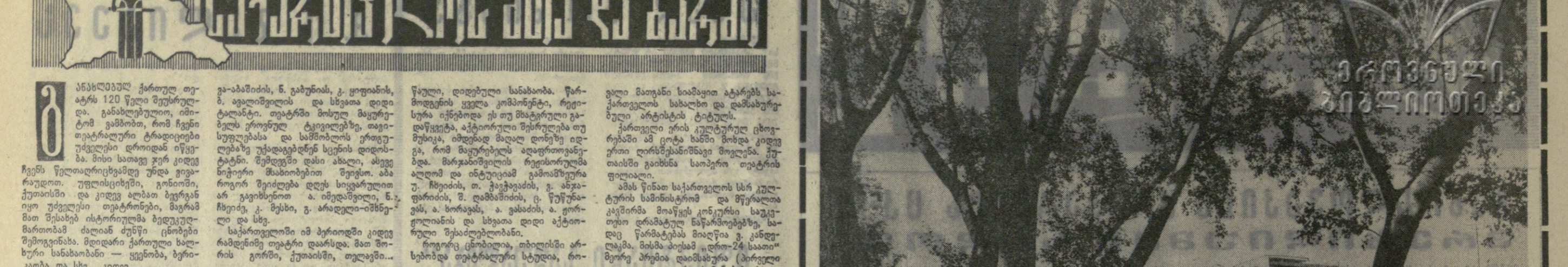
თბილისი, სანაპირო.