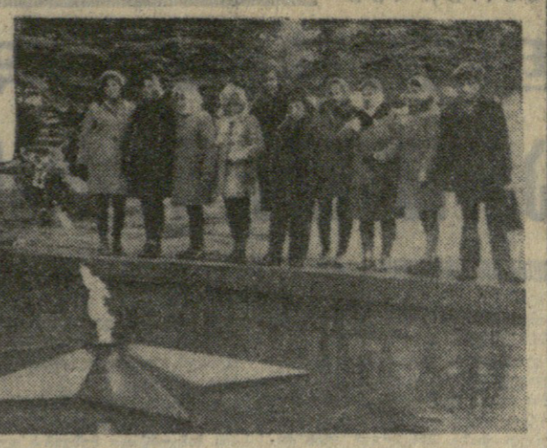
პიონერებმა და მათთვის სკოლის პიონერების მოვალეობა...

ჭადიერი, მესამე წელი, რაც შეგვხვება დამარების ქალაქ ულიანოვის პირველი სახელი სკოლის და ჯადიერი რაიონის სოფელ ორგანიზაციის სახელი სკოლის პიონერებმა, შექმნილი მათთვის უზაზაზაა ერთიანად. ღონისის სკოლის დამფუძნებლებს და კიბორღის ულიანოვის სკოლის პიონერებს. მნიშვნელოვანია კიდევ უფრო გაეფართოვოს სკოლის პიონერებმა მათი სახეობის პიონერებმა და მათთვის სკოლის პიონერების მოვალეობა და მათთვის სკოლის პიონერების მოვალეობა. ულიანოვის სკოლის პიონერებმა და მათთვის სკოლის პიონერების მოვალეობა და მათთვის სკოლის პიონერების მოვალეობა.