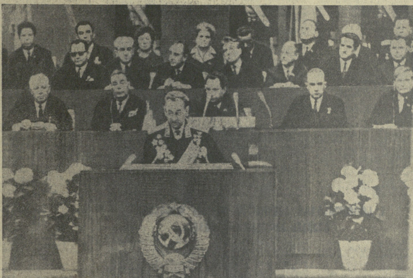
9 მაისს კრების უმაღლესი საბჭოთა კავშირის მინისტრთა საბჭოსადმი წერილი წარმოადგინებენ, არმიისა და ფლოტის მეთაურების საზღვიო კრება, მოსკოვი დიდ სამამულო ომში საბჭოთა ხალხის გამარჯვების 25 წლისთავისდღე, ტრიბუნაზე სსრ კავშირის თავდაცვის მინისტრი, საბჭოთა კავშირის მარშალი ბ. გრემკომ.

რმა, საბჭოთა კავშირის მარშალმა ბ. ა. გრემკომ. (მოსკოვის იმედიბა ჩვენი გა- ზეთის დღემდღვე ნომერში — რედ.) კრების მონაწილენი ერთ- მხედრული დღეს აღვითვანებთ მოდებს მისაღმდებელი წერილი საკვ ცენტრალური კომიტეტისად- მი. სსრ კავშირის უმაღლესი საბ- ჭოს პრეზიდიუმისა და სსრ კავ- შირის მინისტრთა საბჭოსადმი. — ორეცტრა უკრავს მარშს. შე- რიბული ფეხზე უმჯდომარე აცხად- ებენ გამარჯვების დროშას, რომელ- საც დარბაშიდან გაქვთ. საზღვიო კრება დახურულად გამოცხადდა. დარბაშის თაღებში დაღებულად ვერის საბჭოთა კავ- შირის ბიშნი. დიდ სამამულო ომში საბჭოთა ხალხის გამარჯვების 25 წლისთა- ვისდღე მინდებელი საზღვიო კრე- ბის გაიმართა აგრეთვე მოსკოვი- ში რესპუბლიკისა დედაქალაქებში — კიევი, მინსკში, ვარშა- ვში, ბუდაპეშტში, ბერლინში, ვიენაში, ბრაზოვიში, ბრესტში, ვოლკოვო- ვში, ლუბლინში, ერგანში, აშაბადსა და ტურინში, ვიწარსა და სხვა ქა- ლაქებში ლენინგრადში, ვოლოგ- დაში, სვეტოვოლოში, ოდესაში, აგრეთვე ბრესტში, ვლადიკავკ- ასში, სტავროპოლში, ბრასკე- ლში, ბელგოროდში, ბრასკე- ლში, ვორონეჟში, ურსკში, ორიოლში, როსტოვში, სმოლენსკში, ტულა- ში, ულიანოვსკა და ჩვენი ქაუ- შის სხვა ქალაქებში. (საქედის).