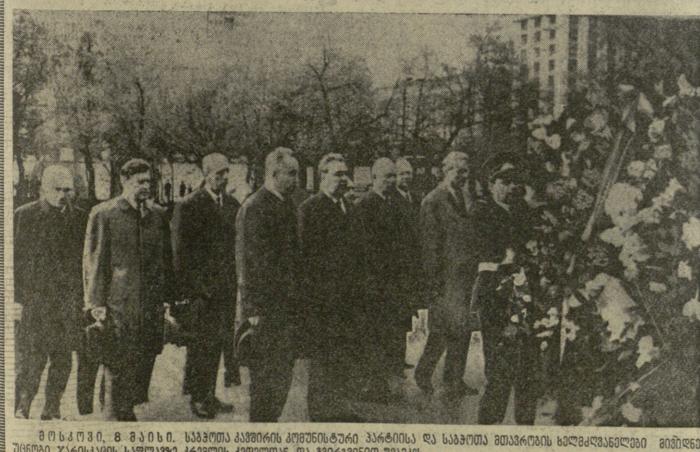
მ თ კ ა ვ შ ი, 8 მ ა ი ს ი. საბჭოთა კავშირის კომუნისტური პარტიისა და საბჭოთა მეთაურების ხელმძღვანელები მიმდინარე უხედრო ჯარისკაცის სავალოდ კრებულს კრებულსა და გმირებთან შეხვედრა.

პენსიონერებისათვის სსრ კავშირის თავდაცვის მინისტრისა 1970 წლის 9 მაისი №112 დ. მოსკოვი