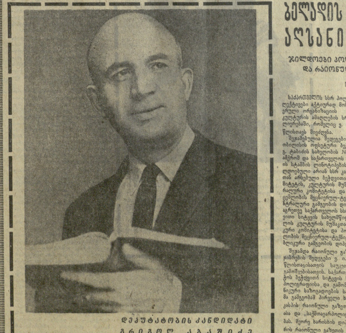
დედატაბობის კანდიდატი ბილინი თბილისის მარქსისტული აკადემიის საბჭოს