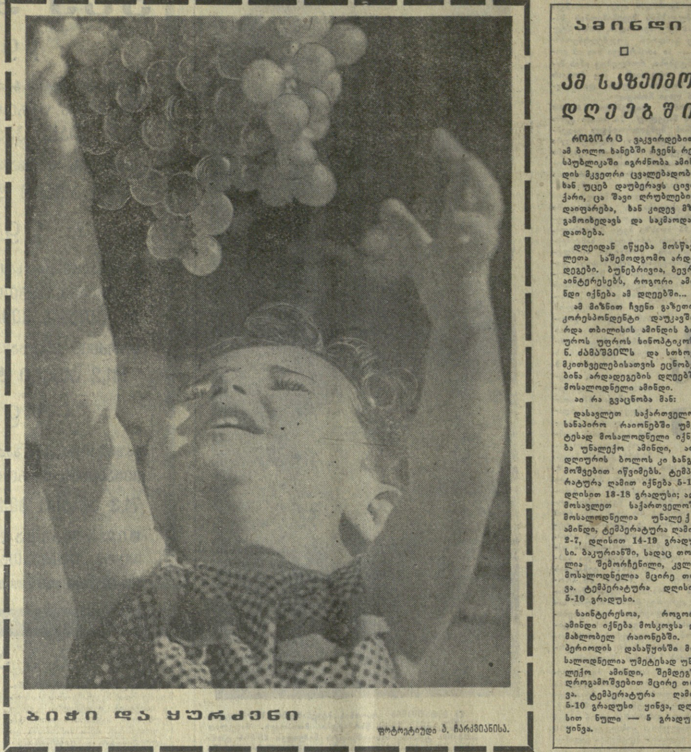
ბიჭი და ყურაქანი...