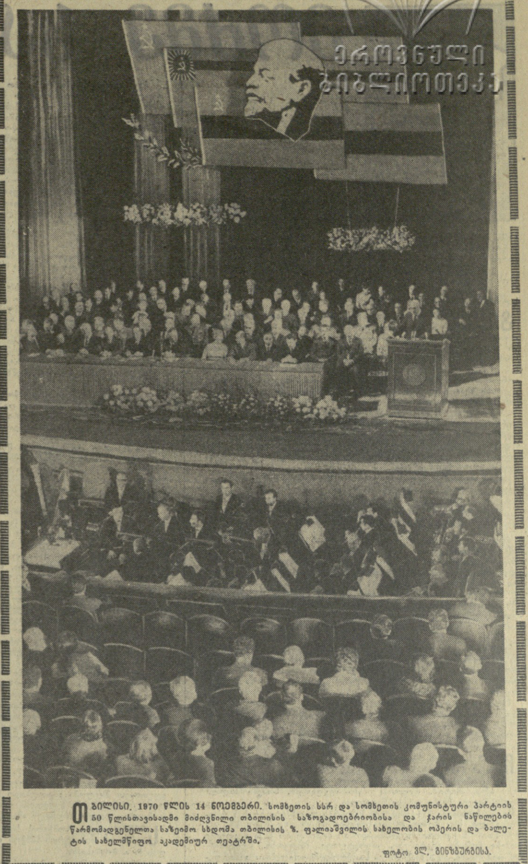
1970 წლის 14 ნოემბერი. სომხეთის სსრ და სომხეთის კომუნისტური პარტიის 50 წლისთავისადმი მიძღვნილ თბილისის საზოგადოებრივ სახლში გაიმართა საქართველოს დელეგაციის მიმართული მიღება. მასში მონაწილეობდა საქართველოს კომუნისტური პარტიის ცენტრალური კომიტეტის პირველი მდივანი ვ. ზ. მუხამბეგოვი.

მან აღნიშნა, თუ რა წარმატებები მოიპოვა სსრკ-ს სომხეთში ეკონომიკის, კულტურისა და მეცნიერების დარგში. მესამე დღეა, — თქვა მან, — ვიმყოფებით სტუმართმოყვარე საქართველოს მიწაზე, და ყველაზე გულთბილად, მეგობრულად გვხვდებით. ზოგჯერ იტყვი გვეყვება, რომ სტუმრად ვართ, რადგან თავი შინ გვგონია.