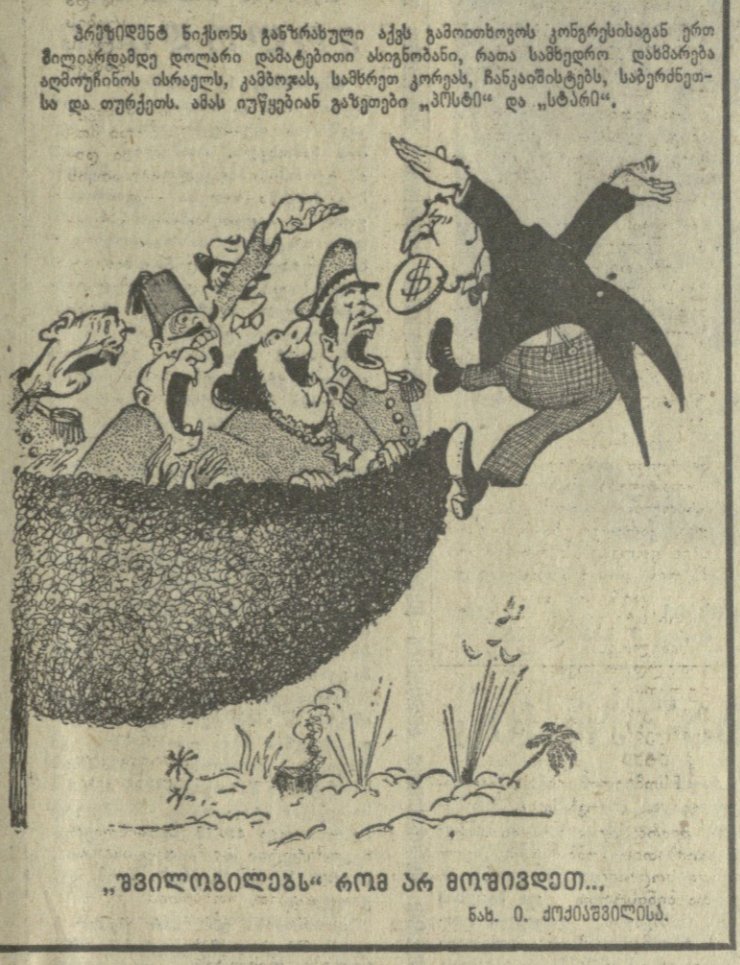
„შვილიშვილს“ რომ არ მოეხივებო...