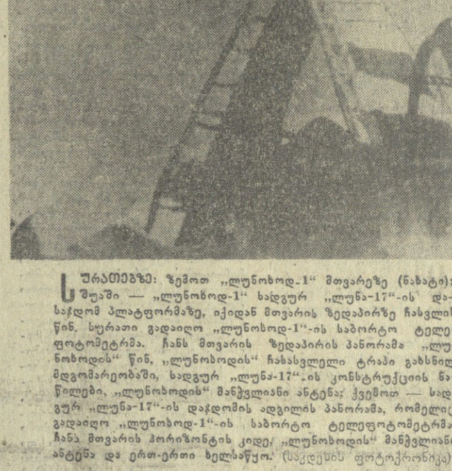
სურათი: მთვარის ზედაპირზე მუშაობის ტელეგამოსახულებათა ხარისხი კარგია.

ტელეფონომეტრები დღემდე მუშაობის ტელეგამოსახულებებს. ტელეგამოსახულებათა ხარისხი კარგია. მთვარის ზედაპირის პარამეტრებზე მუშაობის ტელეგამოსახულებათა ხარისხი კარგია, რომელიც მთვარეზე გარდასულია მთვარის ზედაპირზე დატესტვის, აგრეთვე კარგად ჩანს მთვარეზე მუშაობის კონსტრუქციის ცალკეული ელემენტები.