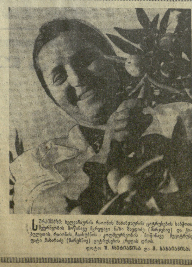
სურამის რაიონის გროსის საბჭოთა მეურნეობის მუშაკნი ხელნაწერის რაიონის გროსის საბჭოთა მეურნეობისათვის ახსნა-მუშავების მიზნით, მუშაკნი ხელნაწერის რაიონის გროსის საბჭოთა მეურნეობისათვის ახსნა-მუშავების მიზნით.

ციხრუსის ბაღები ოქროსფერად ღვანავს. დღეს, ხელნაწერის რაიონის გროსის საბჭოთა მეურნეობისათვის ახსნა-მუშავების მიზნით, მუშაკნი ხელნაწერის რაიონის გროსის საბჭოთა მეურნეობისათვის ახსნა-მუშავების მიზნით, მუშაკნი ხელნაწერის რაიონის გროსის საბჭოთა მეურნეობისათვის ახსნა-მუშავების მიზნით.