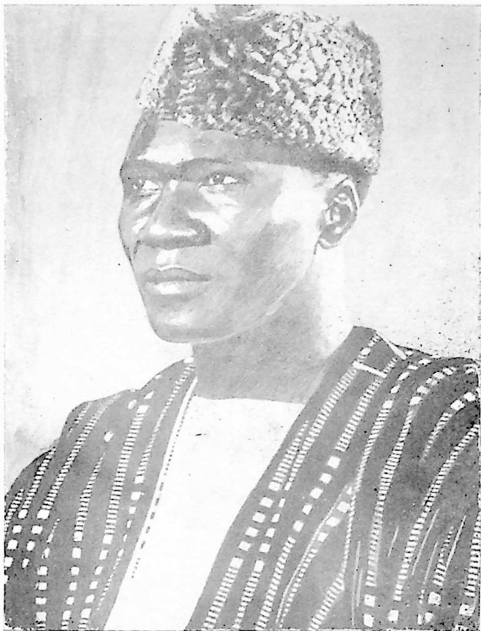
გვინეის რესპუბლიკის პრეზიდენტი აბმედ სეკუ ტურე