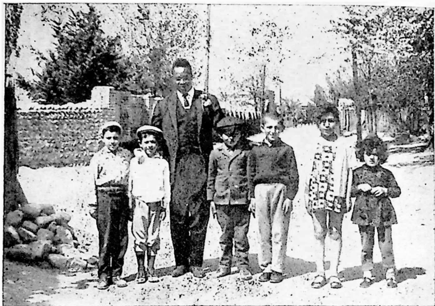
კენის რესპუბლიკის პარლამენტის წევრი, ცნობილი მწერალი კარიუკი სოდ. ხიდისთავში 1966 წელს