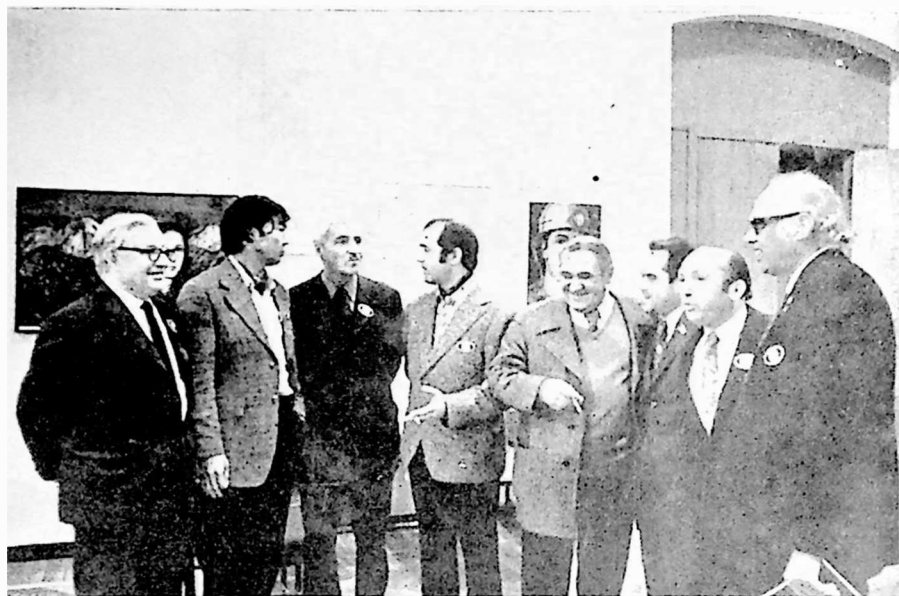
სამხრეთ აფრიკელი ცნობილი პროგრესული მწერალი ალექს ლა გუმა (მარჯვნივ-დან პირველი) მშეიდობის მსოფლიო კონგრესზე მოსკოვში 1973 წელს