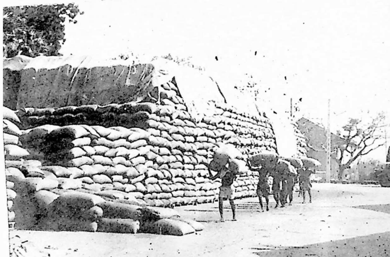
არაბისის საწყობი ლია ცის ქვეშ