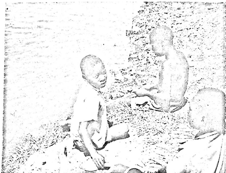
1927 წლის იანვარში. თაგისუფლებაში დაბადებული თაობა