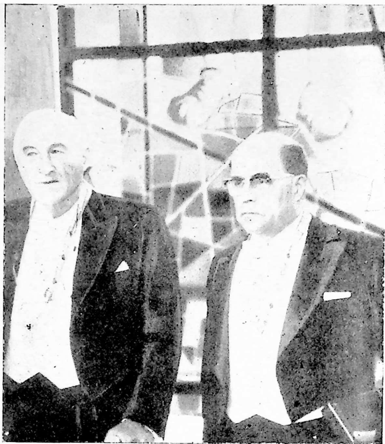
საბჭოთა აფრიკანისტი, სსრკ მეცნიერებათა აკადემიის წ/არკესპონდენტი დ. ოლდეროვე (მარჯვნივ) საერთაშორისო პრემიის მიღების მომენტში (პრემია მიენიჭა აფრიკანისტიკის განვითარებაში შეტანილი წვლილი- სათვის)