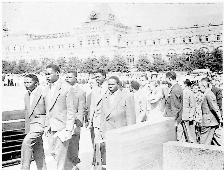
გენეის რესპუბლიკის პარლამენტის დელეგაცია ვ. ი. ლენინის მავზოლეუმთან