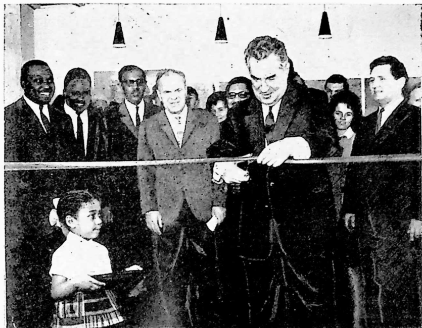
საბჭოთა კავშირ-განის მეგობრობის ცენტრის გახსნა აკრაში 1964 წელს