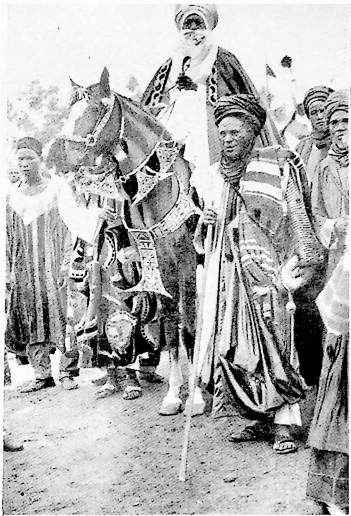
ნიგერია. სოკიტოს სულთანი რელიგიურ დღესასწაულზე