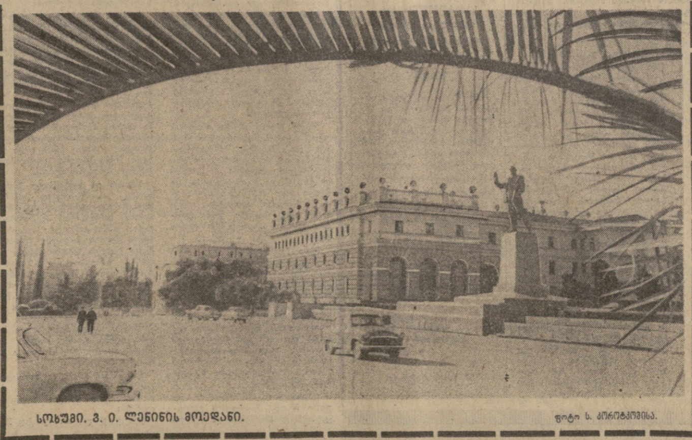
სოხუმი, 3. 0. ლინისის მოედანი.