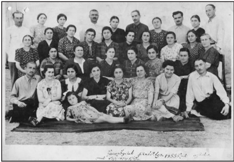
ბავშვების კლასში 1955 წელს. ავტორი - ნანა მერაბიშვილი.

ამ დროს მე წითელწყაროს ქართულ საშუალო სკოლაში ველოდი. ნანამ წარმატებით დაამთავრა უნივერსიტეტი და მშობლიურ სკოლაში დანყებითი კლასების სასწავლო ნაწილის გამგედ დაიწყო მუშაობა. ასწავლიდა, ამავე დროს, მშობლიურ ენასა და ლიტერატურას. იყო სკოლის დირექტორიც. ჰყავს ორი შვილი და სამი შვილიშვილი.