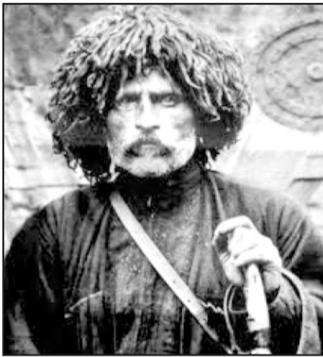
თავად ვაჟა-ფშაველა კი —1862 წელს. რატომ?

—მატონი ამირან, ვაჟა-ფშაველას ბიოგრაფიები პოეტის დაბადების თარიღად 1861 წელს ასახელებენ,