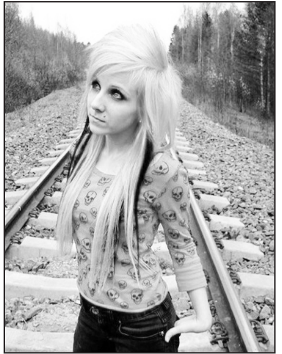
ვირტუალურად ეხმანება ერთმანეთს, თუმცა მათი ხმა სოციალური ქსელის მიხედვით ნაწილად უსმის მხოლოდ, და არა მთელ ქართულ საზოგადოებას...

არ ვიცი, რამდენად იზიარებთ ან ეთანხმებით ამ ახალგაზრდის შეხედულებებს, მაგრამ კარგია, როცა ვიღაც მაინც ხედავს თანამედროვე თაობის შეცდომებს და ამაზე ხმადაღწეულად საუბრობს, თუმცა პრობლემას აქაც ვაწყდებით - ის ანონიმურობა-საა ამოფარებული. როგორც ჩანს, თავისი თაობის წარმომადგენლების რეაქცია ამინებს. კიდევ ერთი პრობლემა, რომელზეც ახალგაზრდები ჯერ არ ლაპარაკობენ, ეს ვირტუალურ სამყარო-