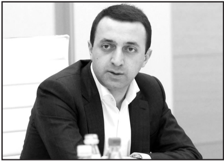
პრემიერ-მინისტრი გარემოს დანაგვიანებისთვის ჯარიმების გამკაცრებას ითხოვს. ამ საკითხზე ირაკლი ლაბიჯაშვილმა მთავრობის სხდომაზე

ისაუბრა და გარემოს დაცვის მინისტრს შესაბამისი დავალება მისცა.