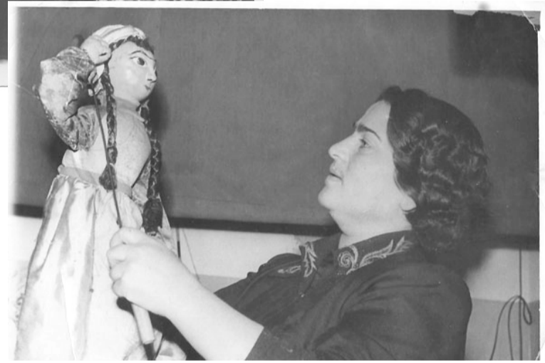
გა აზერბაიჯანული ზღაპრების მოტივზე დანერილი (ავტორები სახელმწიფო საბავშვო თეატრის კოლექტივის სახელით ექვსი