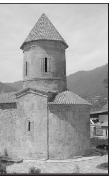
გივის ღვთისმშობლის ტაძარი

ძვირფასო მკითხველებო, ვიმედოვნებთ, თქვენთვისაც საინ-