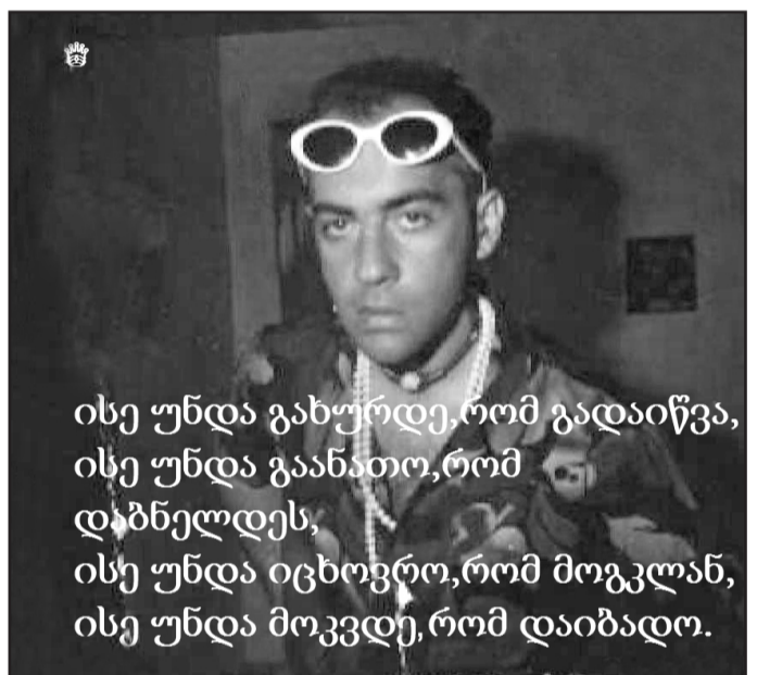
ისე უნდა გახურდეს, რომ გადაიწვა, ისე უნდა გაანათოს, რომ დაბნელდეს, ისე უნდა იცხოვროს, რომ მოგვლან, ისე უნდა მოკვდეს, რომ დაიბადოს.

ირაკლიმ წარმოუდგენელი რამ შეძლო: - მან შეძლო, შეექმნა ნამდვილი ქართული როკი, „ნამდვილი“