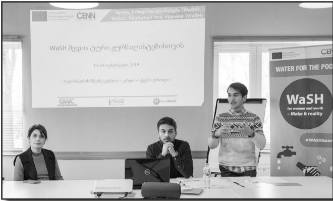
2019 წლის 13-14 თებერვალს CENN, ევროკავშირისა და New World Program-ის მიერ დაფინანსებული პროექტების: „წყალი სიღარიბის აღმოსაფხვრელად“ და

„საქართველოს WaSH (წყალი, სანიტარია და ჰიგიენა) სათემო ინიციატივა (GC-WaSH)“ ფარგლებში ჩატარდა მედია-ტური ეროვნული და რეგიონული მედია ჟურნალისტებისათვის, რომლის მიზანი იყო მედიის როლის გაზრდა ადამიანის უფლებების მიმართულებით წყლის, სანიტარიისა და ჰიგიენის საკითხების გაშუქების პროცესში.