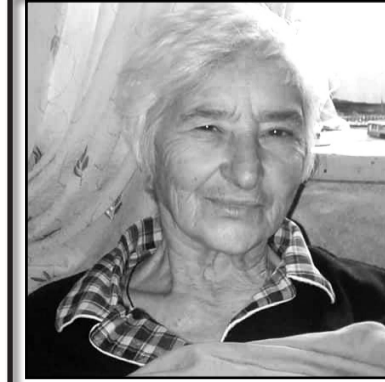
ჩვენო ძვირფასო დედა, შენი წასვლით მძიმე ტკივილი დავგი-