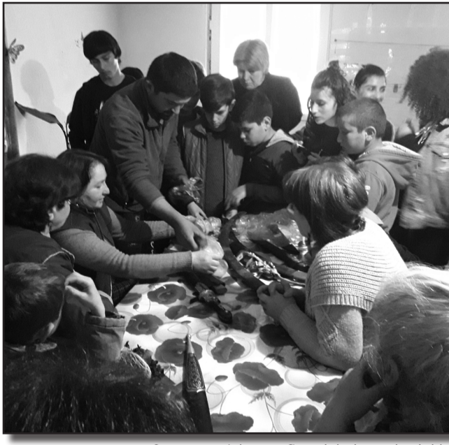
გემგმილი გვაქვს დანტერესებულ პირებს ეს ხელსაქმე ახლოს გავაცნოთ. გამოფენა - ფესტივალის გაკეთების სურვილიც გვაქვს, რომელიც შეიძლება ზონალურიც კი იყოს: ქედი, არბოშიკი და ხორნაბუჯი

განათლების პოპულარიზაციაა. განსაკუთრებით იმ ახალგაზრდებში, რომლებიც მომავალი პროფესიის არჩევის წინაშე დგანან. გვინდა, იმის გააზრება შევეწყო ხელი, თუ რამდენად მნიშვნელოვანია პროფესიული განათლება უმაღლეს განათლებასთან ერთად, უმუშაოდ ხელსაქმეზე, პრაქტიკაზე და ფუნქციური სწავლება, რა სიკეთის მომტანია ის ახალგაზრდებისთვის, მომავალი თაობისთვის. მომავალში სხადასხვა პროფესიის ადამიანებთან შეხვედრასაც გვგეგმათ. აღსანიშნავია ისიც, რომ ქალბატონები ჩვენს სოფელში ხელსაქმით არიან დაკავებულები, რაც საშუალებას იძლევა არამარტო ბიჭებისთვის, გოგონებისთვისაც დაიგეგმოს მსგავსი შეხვედრები. კულტურის სახლში გახსნილია თექაზე მუშაობის კურსი, ბავშვები თექაზე მუშაობენ და სამომავლოდ, და-