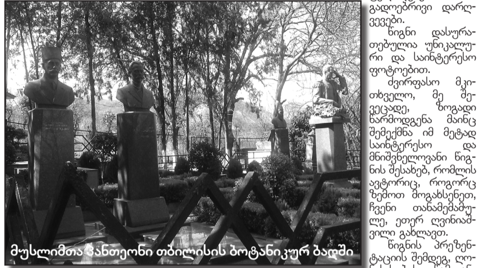
მუსლიმთა განთავსების ბოტანიკურ ბაღში

„ის (ალაჰი) მარადიულია. ეს არის საფლავი განსვენებულისა, მესხალებულისა, ღვინიაშვილისა, ქერბალას მოძიკველი ტუტი ხანუმიასა, ასულისა განსვენებული ჰაჯი ას-ქარ ასუნდ ზადე ხუხელისა. თარიღი - დღე მისი გარდაცვალებისა ოცდახუთი, მავალის თვე, წელი 1291 (ჩ.წ. 1874). ო, ალაჰ, მიუტევე და ჰქმენ სამოთხე მის სამყოფელად. ო, ღმერთო, ფატიმას შვილებს შენეხვით, იყოს მოციქული ჩემი თანამედგომი განკითხვის დღეს. არ დაგვაშრო, ღმერთო მოსწყალო, მოციქულებთან, რელიგიურ წინაძღვრებთან (იმამებთან), ო, მოწყალო“.