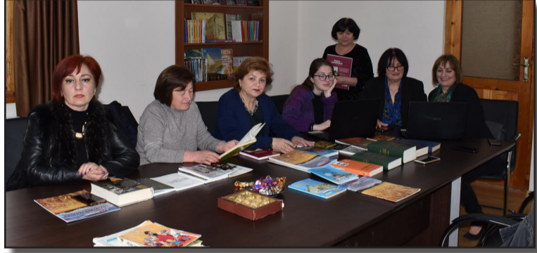
მრჩეველები მრავლად არიან. მე მხოლოდ ერთისკენ შემოძლია მოეუწოდო მათ: “ერთადერთი რჩევა, რაც ერთმა ადამიანმა მეორეს წიგნის კითხვასთან დაკავშირებით შეიძლება მისცეს, არის ის, რომ ყურად არ ათხოვოს, საერთოდ არაანარი რჩევას.” გაითვალისწინეთ ვირჯინია ულფის ეს სიტყვები და იკითხოთ წიგნები “დილოლოგიების ეპოქაში.” მათ (წიგნებს) შეუძლიათ ჩვენი სულის გადარჩენა.

წასაკითხად შენს მკითხველს და გეტყვი, ვინა ხარ შენ.” ამდენად, გერშელი ყოველ ადამიანს, რომელსაც პრეტენზია აქვს სხვებს უჩიროს, თუ რომელი წიგნები იკითხოს, ავალდებულებს, რომ გამოიჩინოს დიდი პასუხისმგებლობა, უპირველესად, თვითონ ჩაუღრმავდეს ამა თუ იმ წიგნში გატარებულ აზრს და რჩევა ამის შემდეგ მისცეს მკითხველს. არც მე ვაძლევ, რა თქმა უნდა, თავს უფლებას, რომ ვინმეს კატეგორიულად მოეზოვო წიგნის ნაკითხვა, ან მითუმეტეს, “არწაკითხა”, მაგრამ ხანდახან ნამომცდებ ხოლმე, ეს რჩევა არ არის, უფრო ემოციას შეიძლება მივანერო, რომელიც წიგნის ნაკითხვის შემდეგ გინდა მეგობარს გაუზიარო. თავს იმით ვიმშვიდებ, რომ ის წიგნი, რომელსაც მე “უჩუქე” ადამიანს, ზედმეტი ნამდვილად არ იქნება არავისთვის. მე არც იმდენად თავხედი ვარ და არც იმდენად ბრძენი, რომ ვუთხრა ჩემს თანატოლებს, რომელი წიგნები შეცვლიან უკეთესობისკენ მათ ცხოვრებას, მადლობა ღმერთს, ასეთი