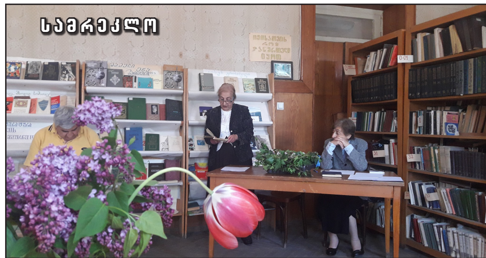
№2 და №3 ბაგა-ბაღის აღსაზრდელებთან. კვირეულის ფარგლებში მოენყო გამოჩენილ ადამიანთა ცხოვრების განხილვა, ასევე „სკოლა-ოჯახი-საზოგადოება“ და „ნიგნი, რომელიც შეიცვალა აზროვნებას“

კვირეულთან დაკავშირებით ცენტრალურ ბიბლიოთეკაში ჩატარდა თემატური გამოფენა, ასევე დასკვნითი ღონისძიება „ვიცნობდეთ და გვიყვარდეს“. შედგა ნიგნის პრეზენტაცია - საბავშვო მოთხრობები და „მიუნაუზუნის თავგადასავალი“ დედოფლისწყაროს