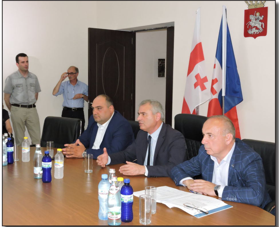
გომარობაზე დადებითად აისახება. მაგრამ, თუკი არ გავუფრთხილებით ჩვენი მუნიციპალიტეტის ბუნებას, თუკი ხანძრებით ნაომარს დავამსგავსებთ ჩვენს რაიონს, ბიოსფერული რეზერვატი ნამდვილად ვეღარ გვიშველის.

შეხვედრაზე აღინიშნა, რომ გარკვეული ფერმერების უპასუხისმგებლო ქმედებით, სასოფლო-სა-