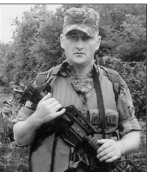
ლობამ 2012 წლის 8 აგვისტოს, მახინჯაურში ერთ-ერთ ქუჩას თეიმურაზ ბერიძის სახელი მიანიჭა.

კაპრალი თეიმურაზ ბერიძე 2008 წლის 11 აგვისტოს შინდისში დაიღუპა, იგი საქართველოს პრეზიდენტის 2009 წლის 6 იანვრის N7 განკარგულებით დაჯილდოებულია მედლით „მხედრული მამაცობისთვის“, მისი სახელის უკვდავსაყოფად კი ბათუმის თეიმურაზ-გე-