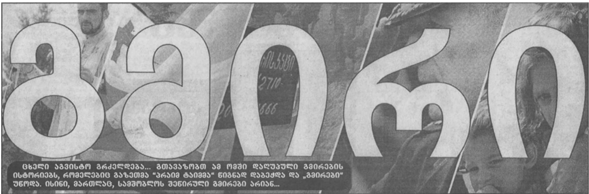
ცხელი ახვისტო გრძელდება... ვითარებამ ამ ომში დაღუპული გვირაბის ისტორიას, რომელიც გახაზა "პრაიმ ტაიმმა" ნიხნად დააქადა და "გვირაბი" უწოდა. ისინი, მართლაც, სამოგლონ შენობის გვირაბი არიან...