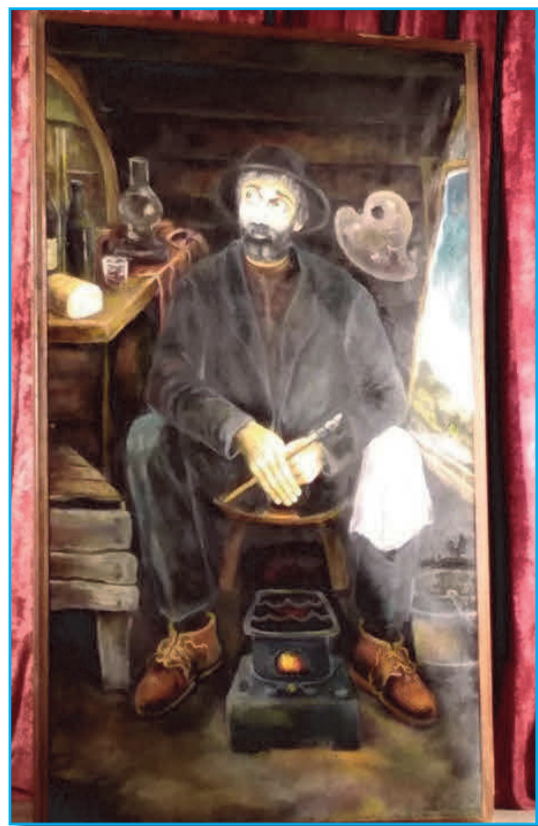
მათ ეს ძალიან ნაადგებათ ცხოვრებაში, პიროვნებად ჩამოყალიბებაში. ამაზე სასარგებლო საქმეს ვერ გაუკეთებთ თქვენს შვილებს. ამას საკუთარი გამოცდილებიდან გორჩეთ, დამიჯერეთ!

არ შემიძლია, არ გამოვხატო ჩემი გულისტკივილი იმის გამო, რომ ამ მშვენიერ და საინტერესო საღამოს ძალიან ცოტა მაყურებელი ესწრებოდა. მშობლებო, ჩაკიდეთ ხელი თქვენი შვილებს და ატარეთ ისინი ასეთ კულტურულ ლონისძიებებზე.