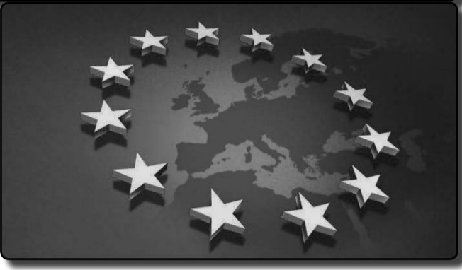
(გაგრძელება გვ. 7)

„რაც უფრო მეტს გეგმავს სახელმწიფო, მით უფრო რთულდება ინდივიდის მიერ დაგეგმვა“. ფრიდრიხ ფონ ჰაიეკი