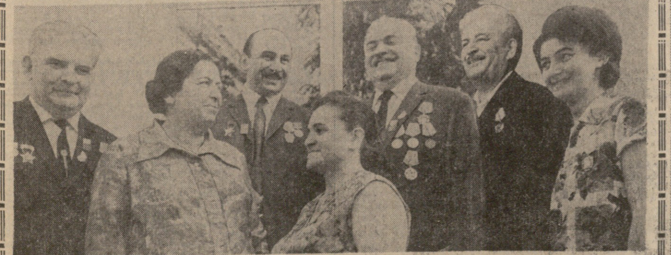
სსრ კავშირის კვების მრეწველობის სამინისტროს განცხადებით...