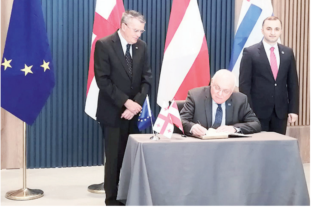
პარტნიორებს, რათა მათ განახორციელონ ის წესები, რომელიც ევროპაში მოქმედებს და ისარგებლონ იმ ბენეფიტებით და პროექტებით, რომლებსაც ევროკავშირი მათ სთავაზობს. ჩვენი ვიზიტის ძირითადი მიზანი თქვენი ქვეყნის

შეხვედრის დასრულების შემდეგ, ჩვენს კითხვებს უპასუხა ფრანც შაუსბერგერმა და აღნიშნა, რომ ევროპის რეგიონთა ინსტიტუტსა და აჭარის რეგიონს შორის თანამშრომლობა 10 წე-