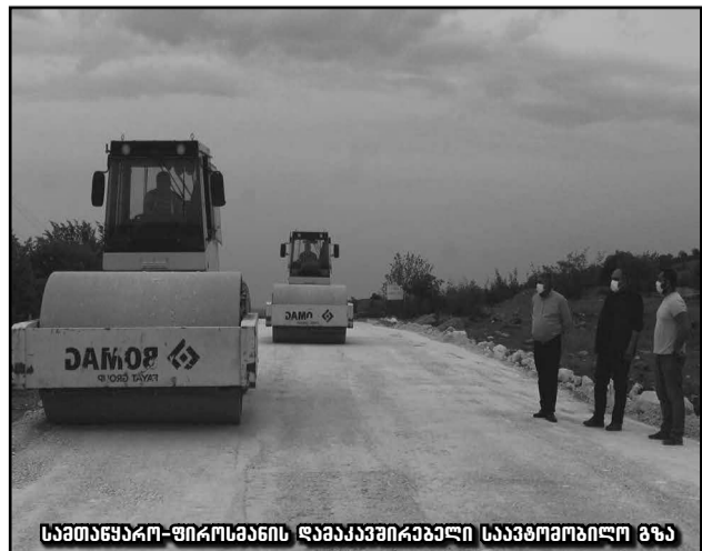
სამთაწყარო-ფიროს-მანის დამაკავშირებელი საავტომობილო გზა

ინფრასტრუქტურული სამუშაოები მიმდინარე წელს დასრულდება და მისი ღირებულება 5 000 000 ლარზე მეტს შეადგენს.