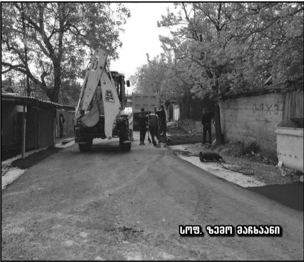
სოფ. ზემო მანხანი

სამთაწყარო-ფიროს-მანის საავტომობილო გზა პროექტ „ქუმბათი-ხირსა-ენამთა-სამთაწყარო-საბათლოს“ ნაწილია და მისი დასრულების შემდეგ ჩვენი მუნიციპალიტეტის ყველა საზღვრისპირა სოფელი ერთმანეთს თანამედროვე სტანდარტების სავტომობილო გზით დაუკავშირდება.