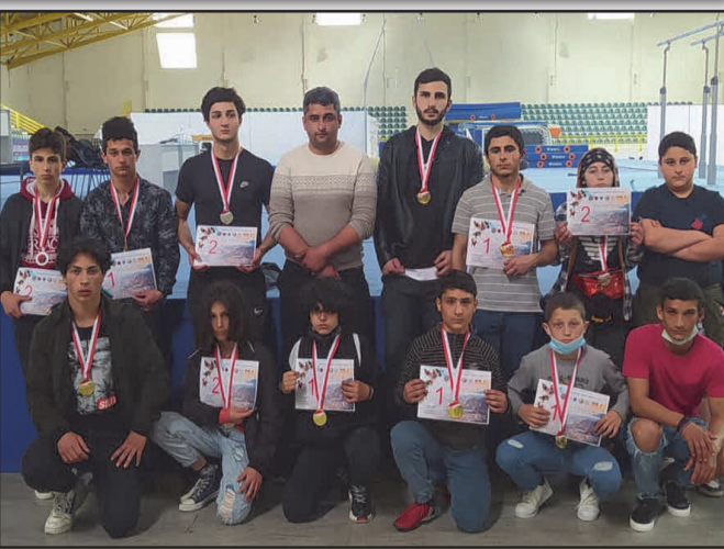
დალიან ბევრი აქტიურობა, წინასწარ არ მინდა საუბარი ამ თემებზე, მაგრამ აუცილებლად გვექნება აქტიურობები. დედოფლისწყაროს უშუს გუნდი მადლობას უხდის ყველა გულშემატკივარს და ასევე დედოფლისწყაროს მუნიციპალიტეტის მერიის სპორტის ცენტრს და მარაბისტს.

- აუცილებლად, 2021 წელს ჩვენი გუნდი 10 წლის ხდება და დაგეგმილი გვაქვს