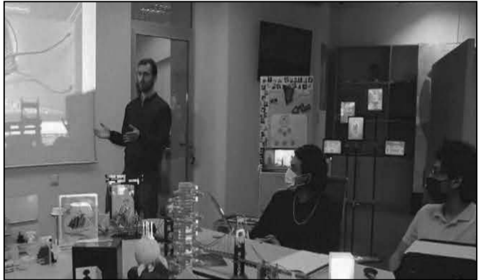
ტერესო ინფორმაცია იხილეთ სტუ-ის საზოგადოებასთან ურთიერთობის დეპარტამენტის მიერ მომზადებულ ფილმში, - აღნიშნულია ინფორმაციაში.

„საქართველოს ტექნიკური უნივერსიტეტის ფაბლაზგის ახალი პროექტის - „ფიროსმანის სმარტ სტენდი“ და ელექტრონული სურათის ტექნოლოგიის შესახებ საინ-