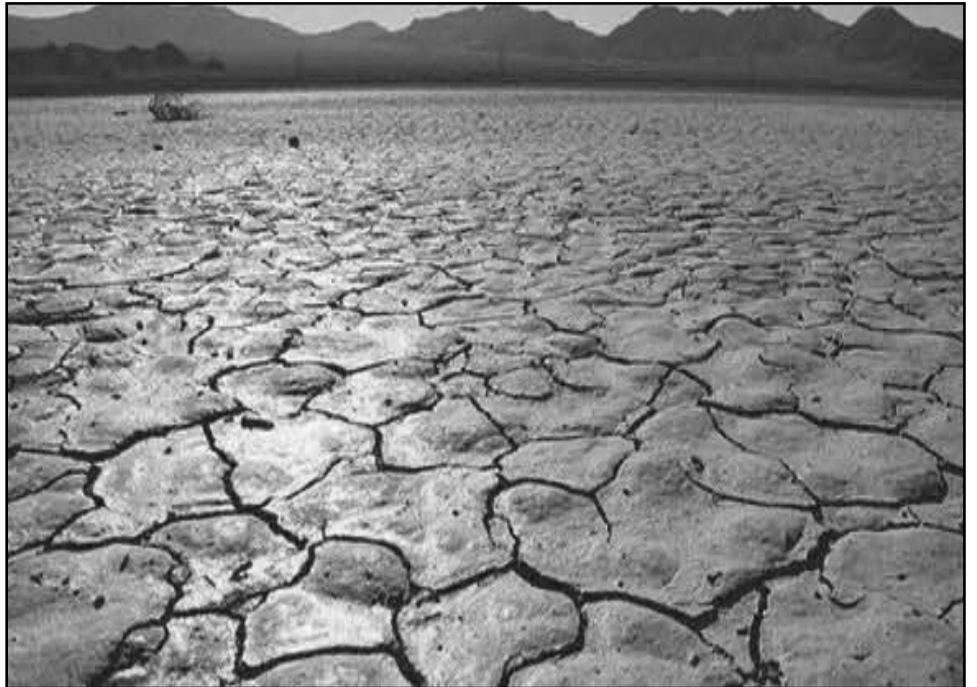
რი სიძხვის) დროს?