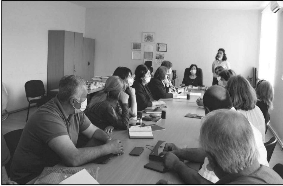
/დასაწყისი გვ. 5/

შესაბამისად სულ უფრო მეტი ადამიანი ან საერთოდ ვერ ბედავს რამე ახალი საქმის დაწყებას, ან მიდის იმ ქვეყანაში, სადაც ნაკლები სირთულეები დახვდება. ესაა მიზეზი იმისა, რომ დღესდღეობით განვითარებული ქვეყნები ასე ნელა ვითარდებიან და ასევე შანსი ისეთი ქვეყნებისთვის, როგორცაა მაგ. საქართველო. რეგულაციების გაუქმებით, გადასახადების დაწევით და ბიუროკრატიის შემცირებით შეიძლება როგორც ქართველი ინოვაციებისთვის ხელშეწყობა, ასევე უცხოელი ინოვაციებისა და კაპიტალის მოზიდვა.