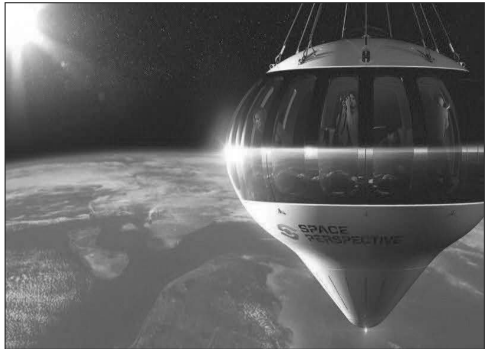
მორიცხავს საშუალო კლასის დამსვენებელს.

დაინტერესებული კომპანიებისა და ქვეყნების თანამგზავრები არიან. „სპეისიქსი“ აჩენს ახალ იმედებს, რადგან ამ კომპანიის მთავარ სტრატეგიად ადამიანის მარსზე გამგზავრებაა დასახელებული. ეს იქნება მზის სისტემაში მესამე ციური სხეული დედამიწის და მთვარის შემდგომ, რომელზეც ადამიანს ფეხი დაუდგამს. რაც მთავარია არსებობს გამოცდილებითი გარანტია იმისა, რომ ილონი და მისი კომპანია ამას შეძლებენ, რადგან 2007 წლიდან მოყოლებული პროცესი გეგმავთიმერად და შედეგადად მიმდინარეობს.