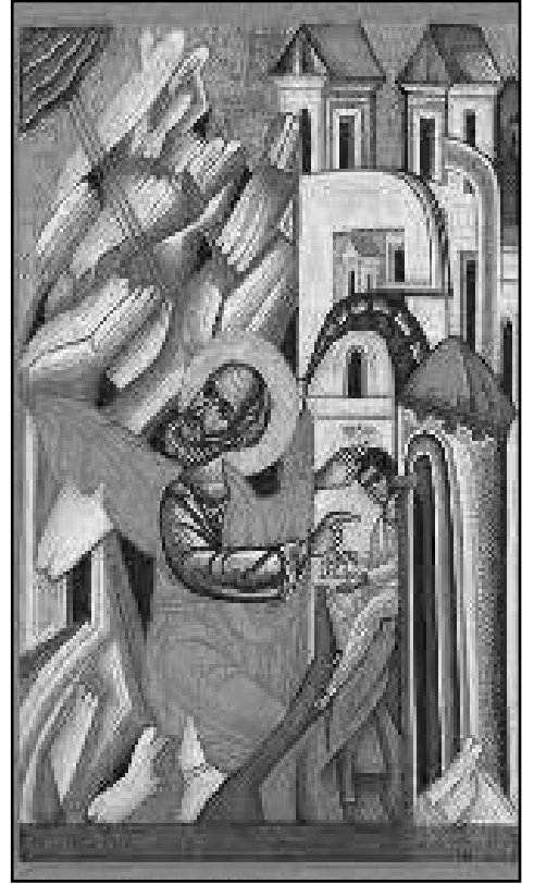
მაგრამ რაც შეეხება ელიაობას, რელიგიურ დღესასწაულს არანაირი შეზღუდვა არ ეხება. როგორც დედოფლისწყაროელებს, ასევე ჩვენი მუნიციპალიტეტის სტუმრებს, ტრადიციულად და შეუფერხებლად შეეძლება ელიას მთაზე ასვლა და მოლოცვა.