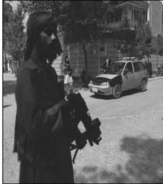
მიუხედავად, მე ის გავაკეთე, რაც სწორად მიმაჩნდა.

ავღანეთი ბოლო ოცი წელიწადია, უცხოური დახმარებით არსებობდა, რაც შეიძლება დასრულდეს. თუ ეს შეწყდა, ისიც კი არ ვიცი, სამუშაოს უფლება რომც გვქონდეს, გადაგვიხდის თუ არა. ვშიშობ, რომ შიმშილობა შეიძლება დაიწყოს.