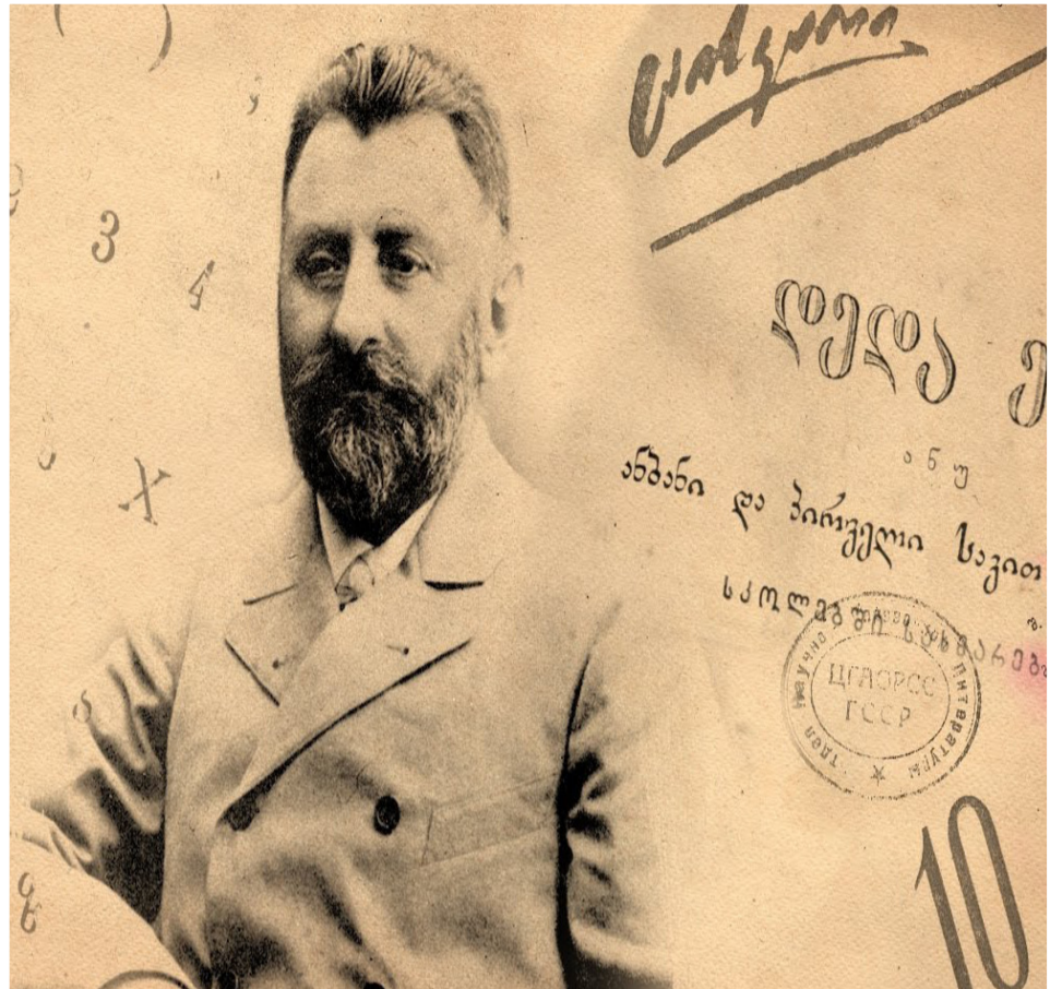
შიშროების წინაშე იდგა:

„დედა-ენა გარეგნობით როდია ადამიანის არსებასთან შეკავშირებული, იგი როდის ჰგავს ტანისამოსსა, რომლის გამოცვლა ადვილად და უვნებლად შეიძლება. მას აქვს ღრმადგამდგარი ფესვები ადამიანის ტვინში, წერებში, ხმის ორგანოებში, ძვალსა-და რბილში, მთელს მის ბუნებაში; იგი არის ძვირფასი იარაღი, რომელიც ბუნებას ზედ გამოუჭრია ადამიანის სულსა და ხორცზედ, მის ფსიქოლოგიურს და ფიზიოლოგიურს აგებულებაზედ. ყოველს ადამიანს დაბადებიდან ჰყვება მიდრეკილება და ნიჭი დედა-ენის ადვილად და ღრმად შესწავლისა სწორედ იმ გვარად, როგორც ბუღბუღს ჰყვება დაბადებითგანვე ბუღბუღის გალობის ნიჭი, იადონს - იადონურის გალობის ნიჭი და სხვა. ბავშვის ყოველ აზრს, წარმოდგენას, გრძნობას და სულის მოძრაობას მხოლოდ დედა-ენა ჰხატავს სინამდვილით და სისრულით.“