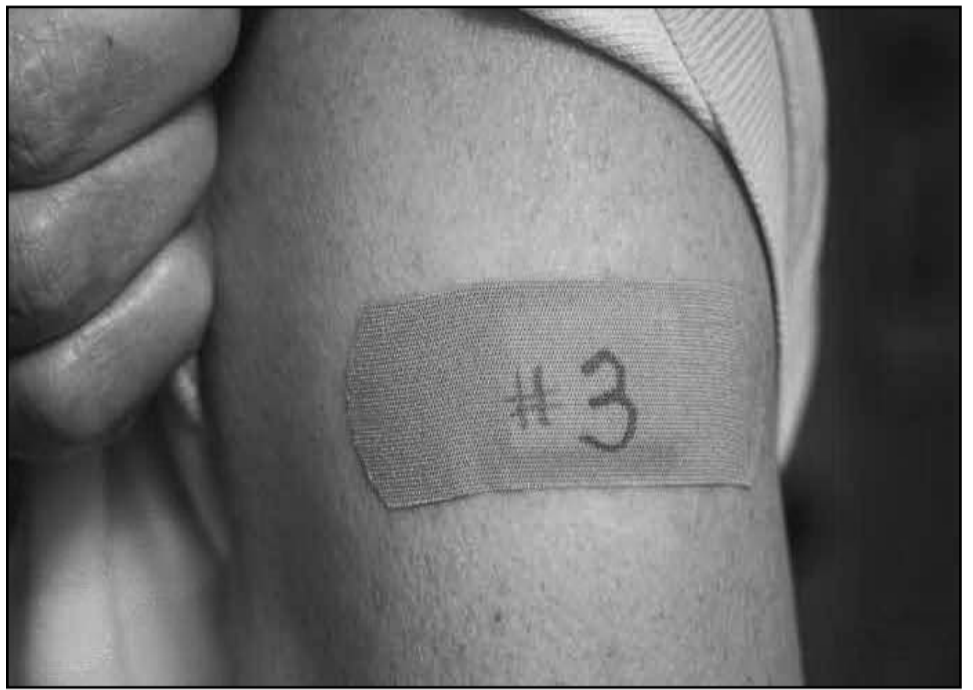
ლევა კი აქ იმეზე მეტია, ვიდრე ჰოსპიტალიზაციის შემთხვევაში. მკვლევრებს არ დაუკონკრეტებიათ, რამდენ ხანს გრძელდება ორგანიზმზე ვაქცინის დამატებითი დოზის მსგავსი გავლენა, თუმცა ზემოხსენებული შედეგები გვიჩვენებს, რომ ის კორონავირუსის წინააღმდეგ ეფექტიანია.

ერთი შეხედვით, შესაძლოა, სიკვდილისგან დაცვის პროცენტული მაჩვენებელი, სხვებთან შედარებით, დაბალი ჩანდეს, მაგრამ ეს ასე არაა. ამის მიზეზი ის გახლავთ, რომ პირველ კატეგორიაში მსხვერპლის რაოდენობამ მხოლოდ 7 შეადგინა, ცდომი-