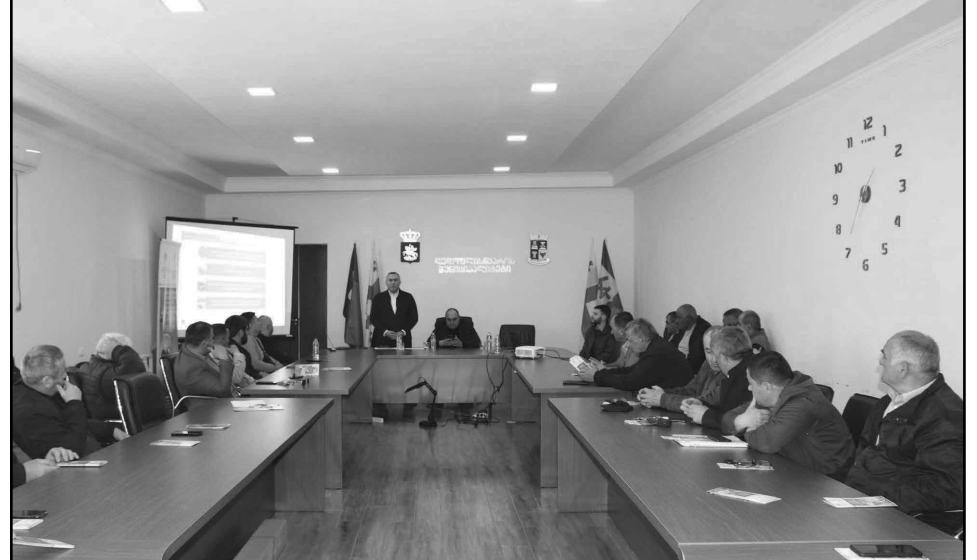
ფლის მეურნეობის სამინისტროსა ( www.mepa.gov.ge ) და მიწის მდგრადი მართვისა და მიწათსარგებლობის მონიტორინგის ეროვნული სააგენტოს ვებგვერდებზე ( www.land.gov.ge ). ხელმისაწვდომი საძოვრების სია ეტაპობრივად განახლდება.

დღეისათვის, უკვე გამოქვეყნებულია 116 საძოვრის მონაცემები სამცხე-ჯავახეთის, კახეთისა და ქვემო ქართლის რეგიონებიდან, საერთო ფართობით - 14786 ჰექტარი; განაცხადების რეგისტრაცია დაწყებულია და 26 აპრილს დასრულდება. დეტალური ინფორმაცია ხელმისაწვდომია საქართველოს გარემოს დაცვისა და სო-