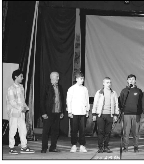
მისი ტრადიციები როგორ თავად მისთვის, ასევე მთელი მსოფლიოსთვისაც, რასაც აღიარებს კიდევ საერთაშორისო საზოგადოება“.

„ნებისმიერ ქვეყანაში, სადაც უნდა ვიყო, ვცდილობ მაქსიმალურად წარმოვარჩინო ჩვენი ქვეყანა იმ კუთხით, რომელიც ჩემი მოღვაწეობის სფეროა და არამარტო. ძალიან მიხარია, რომ ამ შეხვედრამ გამოიწვია ინტერესი. ვფიქრობ, ამის ერთ-ერთი მიზეზი, სწორედ აქტუალურობაა იმ თემებისა, რასაც ეროვნული სატკივარი ჰქვია. ეროვნული პრობლემების მიმართ არ შემცირებულა ყურადღება, მიუხედავად მათ მიმართ ხშირად ნიჰილისტური და ზედაპირული დამოკიდებულებისა. რაც დრო გადის, ვფიქრობ, ის, რასაც ჩვენ ვუნოდებთ ანბანურ წყმმარილებას და რაც შეიძლება ინოდებოდეს წარუვალ, მუდმივ ღირებულებებზე, რომელთა მნიშვნელობაც აქსიომატური უნდა იყოს, ნელ-ნელა დავიწყების პირასაა. როდესაც ამ ღირებულებათა სრულიად არალოგიკური გადაფასება მიმდინარეობს, ეს პროცესი შეიძლება სახიფათო აღმოჩნდეს ჩვენი შემდგომი თაობებისთვის. ჩვენი შვილების ტრადიციების დამახანჩვებულად წარმოჩენას და ღირებულ ასპექტებზე მახვილების არასწორ დასმას, უმეტესწილად, ფაქტურ შედეგებამდე მივყავართ ხოლმე. რადგან, სწორედ ეს თაობაა ყველაზე მეტად მონყვლადი. ჩემი სემინარის მიზანიც ისაა, რომ ჩვენს და მომავალ თაობას შევასხენოთ ეროვნული ღირებულებები, რათა უკეთ ვიყოთ შეიარაღებული იმ ცნობებით, რომელიც დღევანდელ დღეს ყველაზე მნიშვნელოვანია. ვინაიდან, დღეს, სწორედ ინფორმაცია ყველაზე მთავარი და ამ საინფორმაციო ომსა თუ ჭიდილში მთელი კაცობრიობა ლაშობს, რომ თავისი კულტურა მაქსიმალურად წარმოაჩინოს. საჭიროა გავითავისოთ, რომ რაც უფრო უძველესი ისტორიის მქონეა ერი, მით უფრო ღირებულია