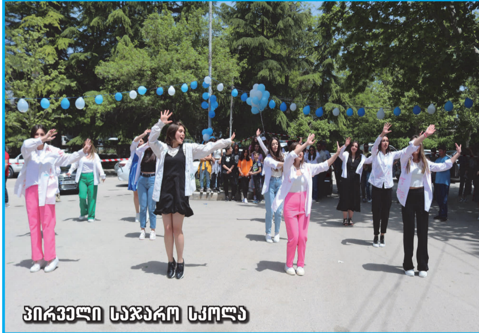
ზირველი საჯარო სკოლა