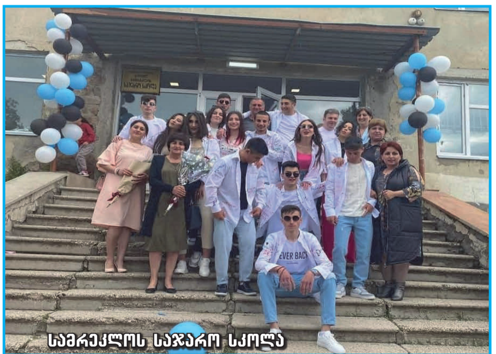
სამხეკლოს საჯარო სკოლა

გაზეთი „შირაქი“ ყველა კურსდამთავრებულს ულოცავს სკოლის დამთავრებას, უსურვებს მათ ბედნიერ მომავალს და წარმატებებს ცხოვრების ახალ ეტაპზე.