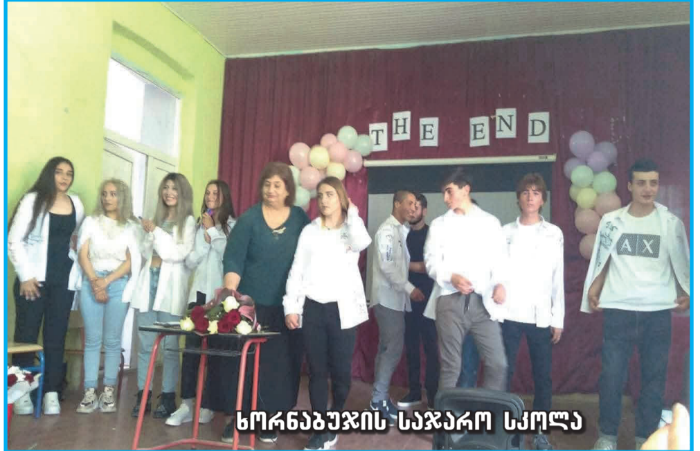
სორნაბუჯის საჯარო სკოლა