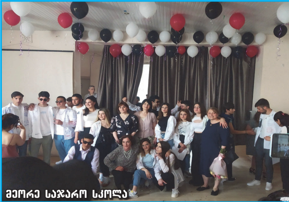
მეორე საჯარო სკოლა