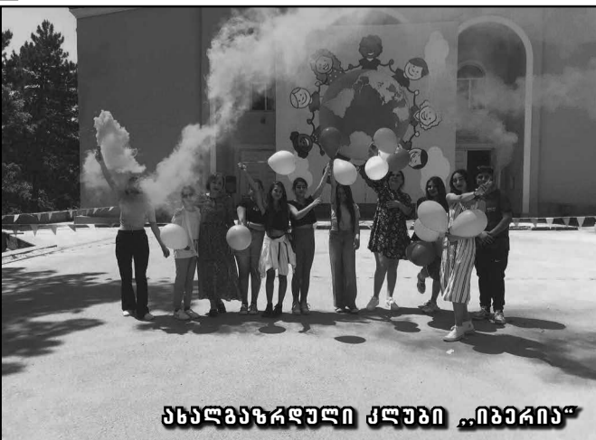
ახალგაზრდული კლუბი „იბერია“

1 ივნისი - ბავშვთა დაცვის საერთაშორისო დღე აღნიშნეს ახალგაზრდული კლუბის - „იბერიას“ წევრებმა. უფროსკლასელებმა ჩაატარეს ქუჩის გამოკითხვა, მონვეულ ბავშვებს გაცნეს ამ დღის შექმნის ისტორია და ისაუბრეს ბავშვთა უფლებების დაცვაზე. ღონისძიების დასასრულს გადაიღეს სამახს-