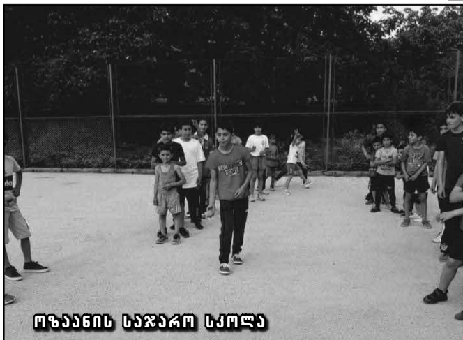
ოზანის საჯარო სკოლა

ფიროსმანაშვილი და მუნიციპალიტეტის თითოეულ ბავშვს და მოზარდ თაობას კიდევ ერთხელ ულოცავს ბავშვთა დაცვის საერთაშორისო დღეს, მშვიდობას და კეთილდღეობას უსურვებს მათ.