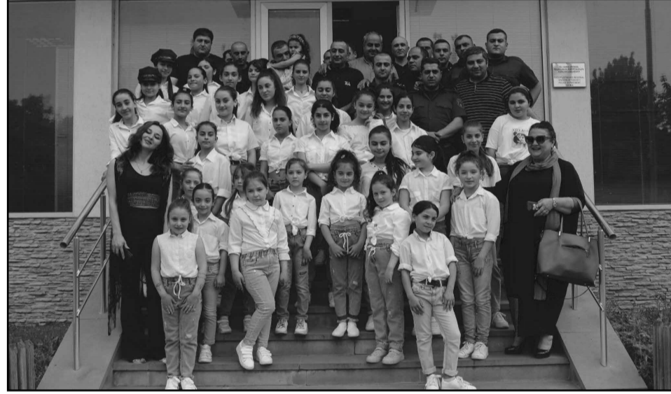
პოლიციელებს პროფესიული დღე ცეკვის სტუდიის აღსაზრდელებმაც მიულოცეს, რომლებმაც პოლიციელებთან ერთად სამახსოვრო ფოტოები გადაიღეს.

დედოფლისწყაროს მუნიციპალიტეტის მერმა ნიკოლოზ ჯანიაშვილმა შინაგან საქმეთა სამინისტროს კახეთის პოლიციის დეპარტამენტის დედოფლისწყაროს რაიონული სამმართველოს თანამშრომლებს პროფესიული დღე მიულოცა და განეული საქმიანობისთვის მადლობა გადაუხადა.