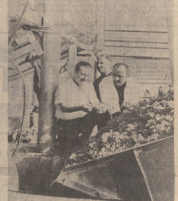
სურათები: 3. ბანიძის ხელოვნება და 6. ბერიძის ხელოვნება