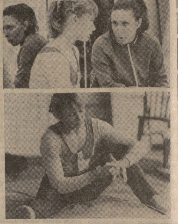
ეს მოხდა ლეზარდში