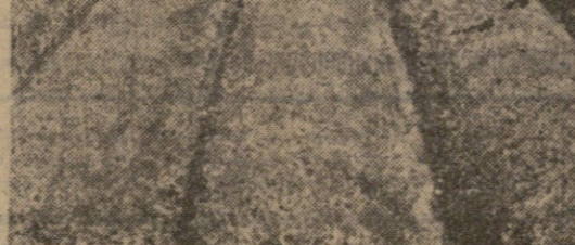
საქართველოს შრომის წითელი დროის ორგანიზაციის სახელით-სამურე ინსტატუსის რეკტორი, პრეფსორი.