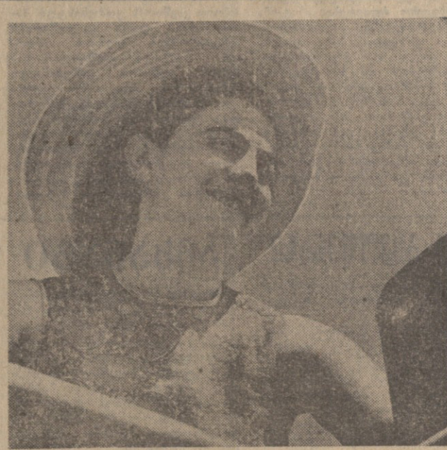
აი, ვინც შრომით მუშაობს

რესპუბლიკის ჩაის აღსრულებული პერიოდ-ლეგა სახელმწიფოს ჩაბარება 262.300 ტონა პალახარისსო-პანი ნაღველი, რაც 26 ათასი ტონით აღემატება გეგმას და 12 ათასი ტონით — ნაჩისრ პალახარებს.