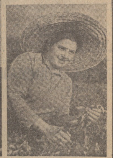
აი, ვინც შრომით მუშაობს