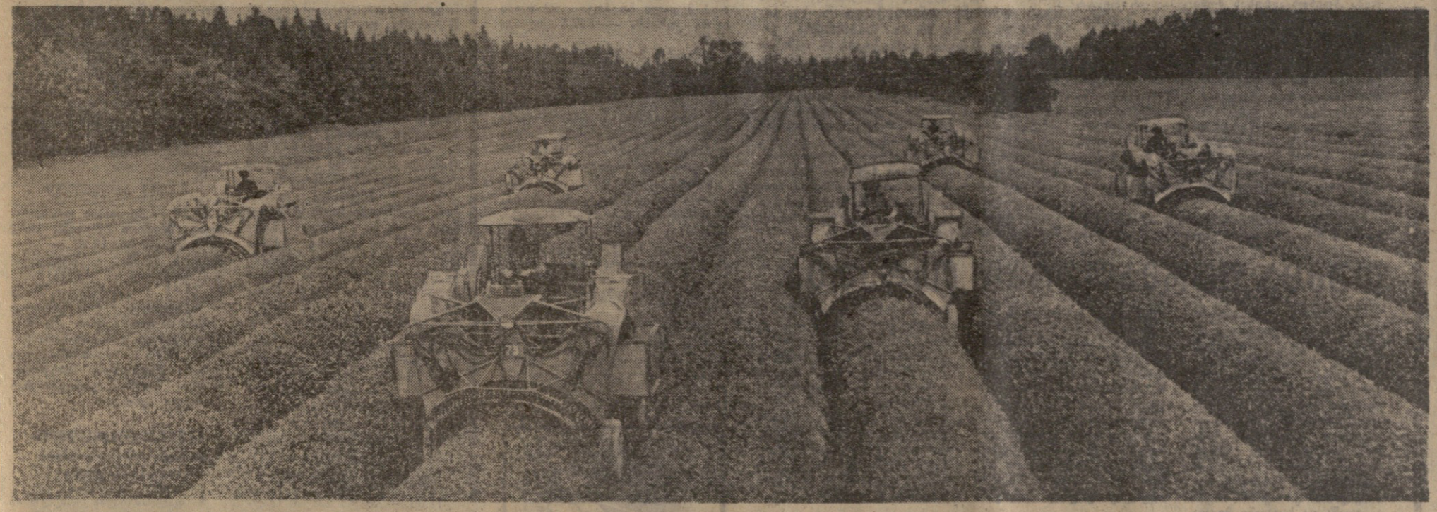
ჩვენი საკარგი ხემალია ზედათა რაიონის ინგოლის სახეობის მშენებლის პლანტაციის.