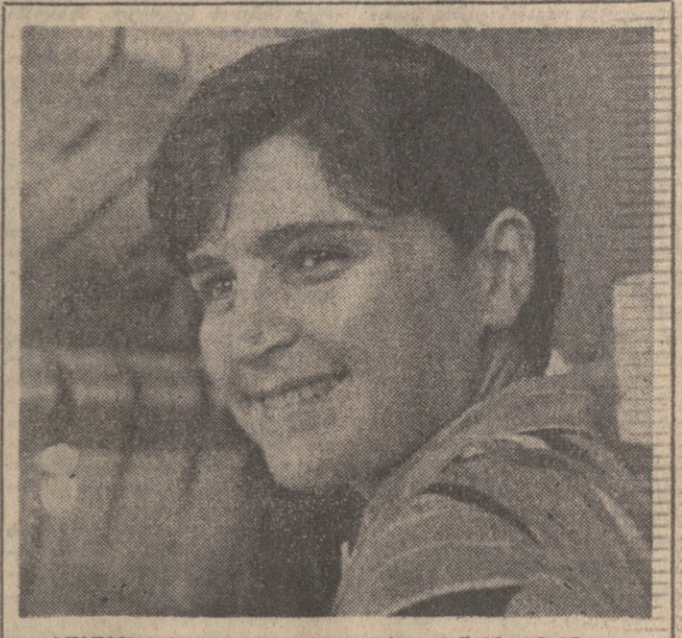
სოფლის სესხის ფარგლებში კოლმეურნის წარმატებულად დღე-ღამეში მოქმედებს კომუნისტური სოფლის მეურნეობის მეთოდებს, რომლებიც სწავლობს სოფლის მეურნეობის მეთოდებს, რომლებიც სწავლობს სოფლის მეურნეობის მეთოდებს...