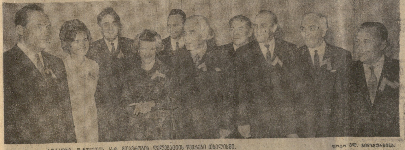
სსრ კავშირის მინისტრთა საბჭოს მიერ უმაღლესი სასწავლებლის სტუდენტთა და სსრ კავშირის მინისტრთა საბჭოს მიერ