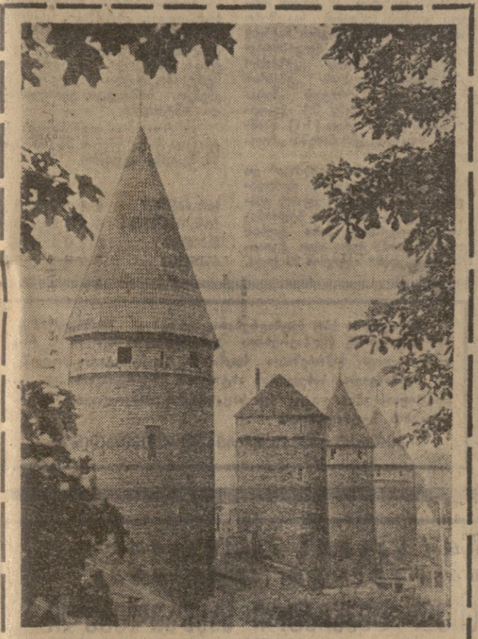
კოვაკის მონასტერი ტალოში.