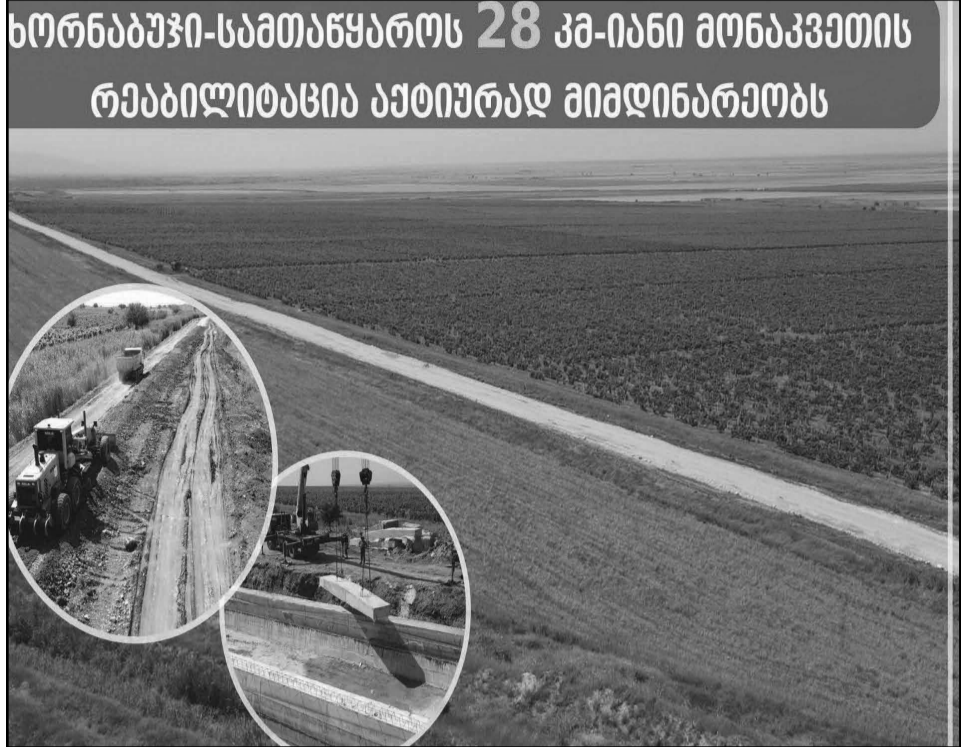
ხორნაბუჯი-სამთაწყაროს 28 კმ-იანი მონაკვეთის რეაბილიტაცია აქტიურად მიმდინარეობს

აღნიშნული პროექტები, გუმბათი-ხირსა-ენამთა-სამთაწყარო-საბათლოს საავტომობილო გზის 67 კმ-იან მონაკვეთზე საგზაო ინფრასტრუქტურის სრულად მოწესრიგებას და არსებული პრობლემების აღმოფხვრას უზრუნველყოფს.