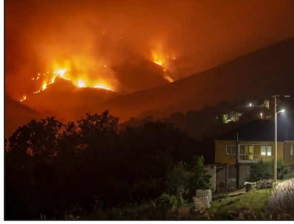
დასავლეთ ევროპის ქვეყნებში ტყის ხანძრებს ებრძვიან, რის გამოც ათასობით ადამიანის ევაკუაცია გახდა აუცილებელი. უკვე რამდენიმე დღეა გავრთიანებულ სამეფოში შაერის ტემპერატურა 40 გრადუს ცელსიუსს აღემატება, რაც ქვეყნისთვის რეკორდული მაჩვენებელია.

საფრანგეთში გასული დღე-ღამის განმავლობაში 64 სხვადასხვა არეალში ქვეყნის ისტორიაში ყველაზე მაღალი ტემპერატურა დაფიქსირდა. ჟირონდას დეპარტამენტში ხანძარი 19 3000 ჰექტარ ტერიტორიას