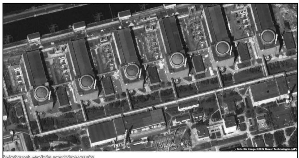
ზაპოროჟიის ატომური ელექტროსადგური

უკრაინული მედიის ცნობით, ზაპოროჟიის ატომური ელექტროსადგური ახლა შესაძლოა რადიაციისა და უსაფრთხოების სტანდარტების დარღვევით მუშაობდეს, გარდა ამისა შესაძლოა, ოკუპანტებს დაენალმა სადგურის ტერიტორია. შეგახსენებთ, რომ 25 აგვისტოს ევროპაში უდიდეს, ზაპოროჟიის ატომურ ელექტროსადგურს, პირველად არსებობის ისტორიაში, ორჯერ შეუწყდა ელექტროენერჯიის მიწოდება, რაც აუცილებელი პირობაა ობიექტის ბირთვული უსაფრთხოების უზრუნველსაყოფად.