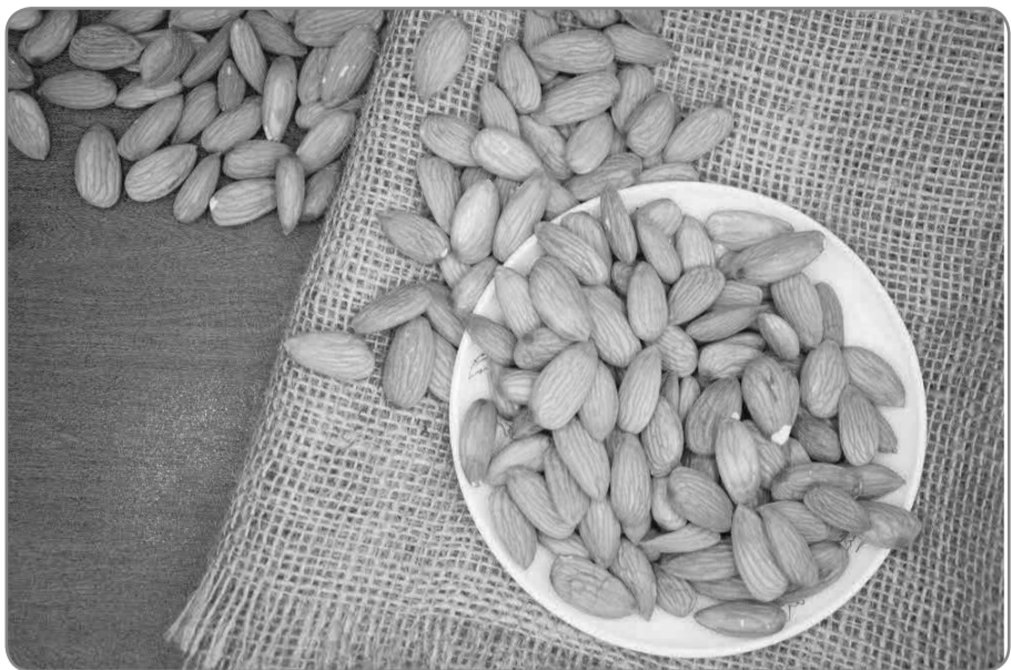
ცნობისთვის: დედოფლისწყაროს რაიონში მდებარე მეურნეობა სეზონურად 60-მდე ადამიანს ასაქმებს, ყოველდღიურად კი ბალებში 20 ადამიანი მუშაობს. თხილთან ერთად ბოლო წლებში ქართულ ბაზარზე ფების მოკიდება სხვა კაკლოვანმა კულტურებმაც დაიწყო. ასეთია მაგალითად ნუში, რომლის ბალების გაშენებაც ქვეყანაში სულ ცოტა ხნის წინ დაიწყო, თუმცა, გაშენებული ფართობებით ნამდვილად შეგვიძლია ვიამაყოთ.

„ბანკი ყველა ეტაპზე მხარში მედგა. პირველად მათი დაფინანსებით 20 ჰექტარზე ვენახი გავაშენე, მოსავლის აღების შემდგომ კი ვაღდებულემა უპრობლემოდ დაფარე. ამასთან, ბანკის დახმარებით ახალი მიმართულებაც ავითვისე და ესპანური ნუშის ბალები გავაშენე, კრედიტის დაფარვა 5 წლიან პერიოდში მოხდება“, - აღნიშნავს მენარმე.