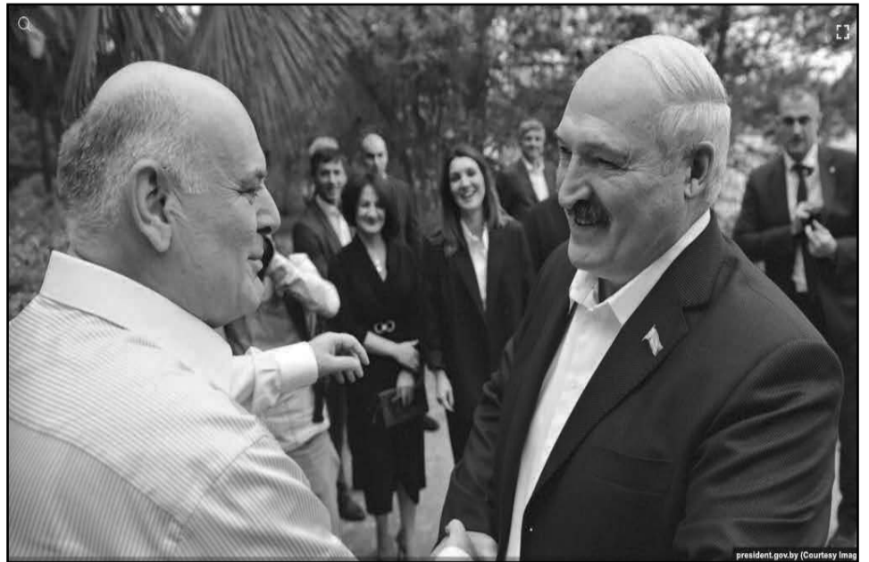
„საქართველოს ოკუპირებული ტერიტორიე- ბის შესახებ კანონის დაუშვებელი დარღვევა“ უნოდეს. საქართველოს საგარეო საქმეთა სამინისტროში დაიბარეს ბელარუსის ელჩი, ხოლო საელჩოსთან პარტია „გირჩი-მეტი თავისუფლების“ ორგანიზებით საპროტესტო აქცია გაიმართა, რომელზეც პუტინისა და ლუკაშენკოს პორტრეტები დანდეს.