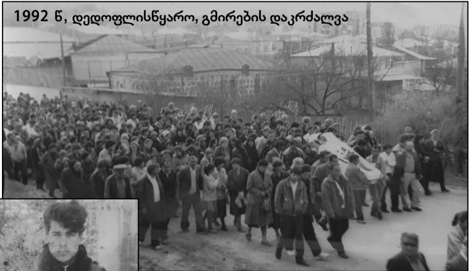
1992 წ, დედოფლისწყარო, გმირების დაკრძალვა

მეხუთე კლასამდე კლასის ფანჯარასთან ვიდექი. გაკვეთილზე თუ არ მხედავდა, ისე ვერ ისვენებდა. მასწავლებლებს უკვირდათ, დედა-შვილის ასეთი სახელოვე და სიყვარული იმიტითაო. სამსახურში წასვლისას გავეპარე-