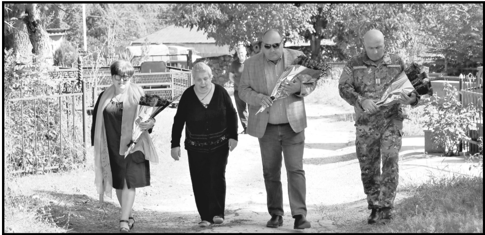
დაღუპულთა ხსოვნის პატივსაცემად დედოფლისწყაროს მუნიციპალიტეტის ყველა ადმინისტრაციულ შენობაზე დამუშავებული იყო სახელმწიფო დროშები.

ბი რომ მოდიოდნენ, ხელს უქნევდნენ, გაგვაცოლებით და თურმე არაფერი გაუჩერა. თორემ, თუ ჩანდავინდნენ, ალბათ, ესენიც გადარჩებოდნენ. როგორც მითხრეს, რადგან ფეხით მივრბოდნენ, ამიტომ დაეცნენ, ალბათ, სწრაფად ესროლა... თურმე, სიკვდილის წინა ღამეს ბიჭები მღეროდნენ და ერთ-ერთს უთქვამს, „ნეტა ხედავდი თუ ვიქნებოდა ცოცხლები“. ცხედრები ლანჩხუთის საავადმყოფოში ამოიცივნეს ბიჭებმა. ალბათ, ეს ენერა ჩემს შვილს... ჩემთვის უცნობია, რამდენი ხანი გაატარა ჩემმა შვილმა ბრძოლის ველზე, როდის წაიყვანეს, არ გამოვინახე. ისიც არ ვიცი, კონკრეტულად რა ადგილას დაეცა. დაკრძალვის დღეს გაირკვა, რომ სასახლე პატარა იყო და ვერც სასაფლაო დაეხურებოდა. მაღალი იყო და ვერ მოვრგო. ავტორი, ისე ვერ დავმარხავ ჩემს შვილს, დაკრძალვა გადავლოთ-მეთქი. არვივით სასახლეები და მანქანები წაუღიათ. სამხედროებმა დამამშვიდეს, ახალს დავამზადებთო და საღამოს მოიტანეს. ბევრი ხალხი ესწრებოდა, მთავრობა და სამხედროებიც იყვნენ. მათვე შეარჩიეს ახალი ადგილი სასაფლაოზე და გადამსა, რომ სამხედროები ერთად დაკრძალულიყო. დაკრძალვასთან დაკავშირებული ყველანაირი ხარჯი ხელისუფლებამ დაფარა. სმირად მივიღივარ საფლავზე. არ შემეძლია